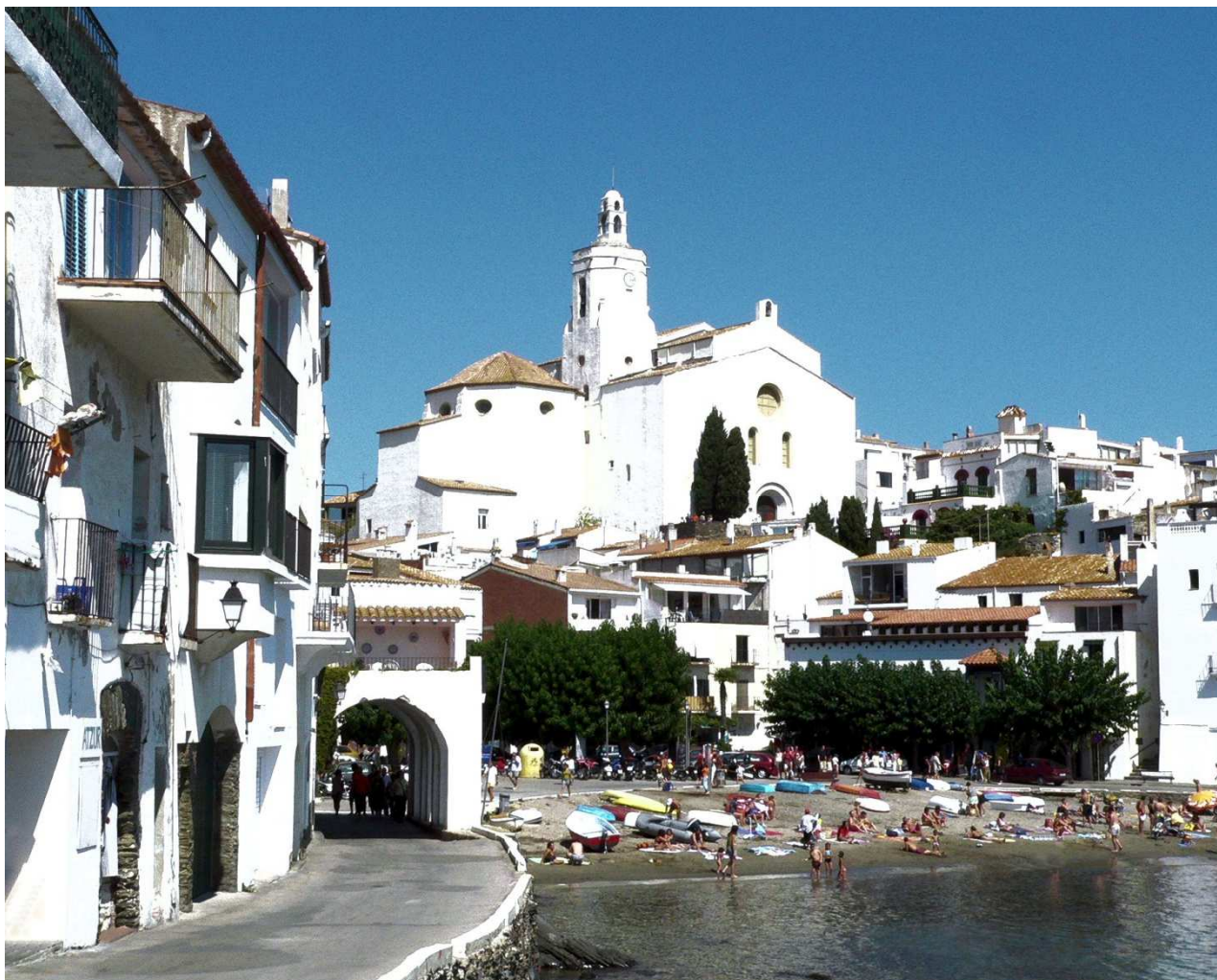
Port Alquer et l'église Santa Maria