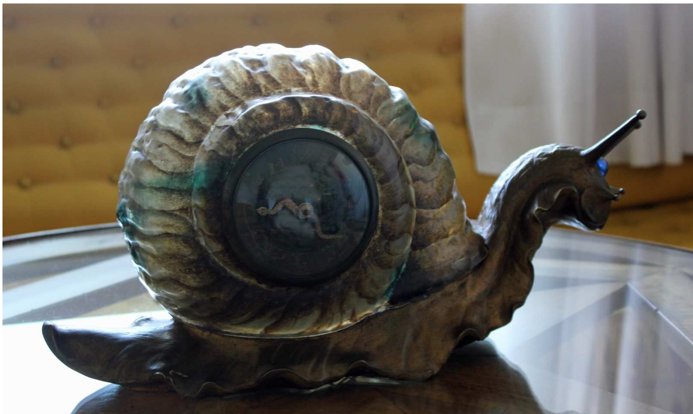
La pendule escargot – Maison Dali