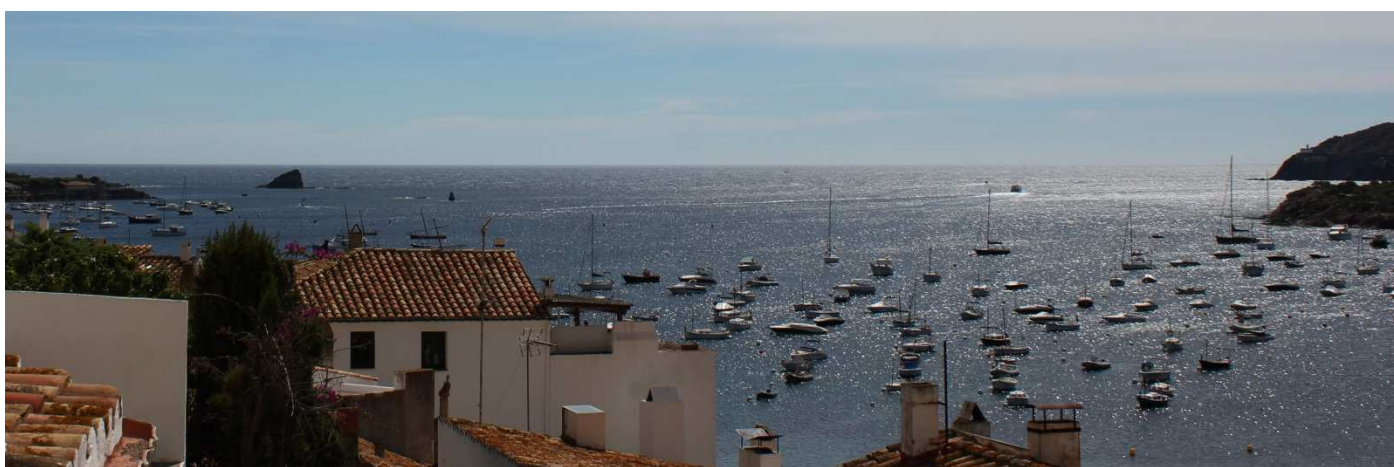
La vue du haut du village depuis l'église Santa Maria