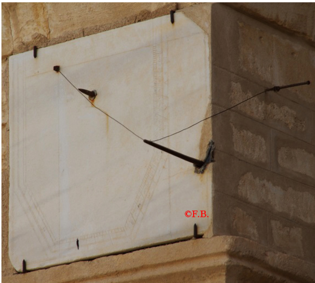
Cadran vertical relativement effacé

Le cadran solaire TN001 horizontal, en marbre blanc, est muni de quatre gnomons. Il donne les heures des cinq prières : O La prière de l'aube - A Sabah - La prière de la mi-journée - adh-dhouhr -, N La prière de l'après-midi - al-'asr -, E La prière du coucher de soleil - al-maghrib -, E La prière du soir - al-'icha . Une inscription en alphabet arabe - naskh - est gravée sur la table, elle donne le nom du gnomoniste musulman Ahmad Ibn Qasim Ibn Ammar Al-Susi qui a tracé le cadran selon le calendrier musulman en 1258 étant 1870 du calendrier grégorien. En bas à droite, un plan stylisé de la mosquée avec la QIBLA : → la ligne qui indique la direction de La Mecque.