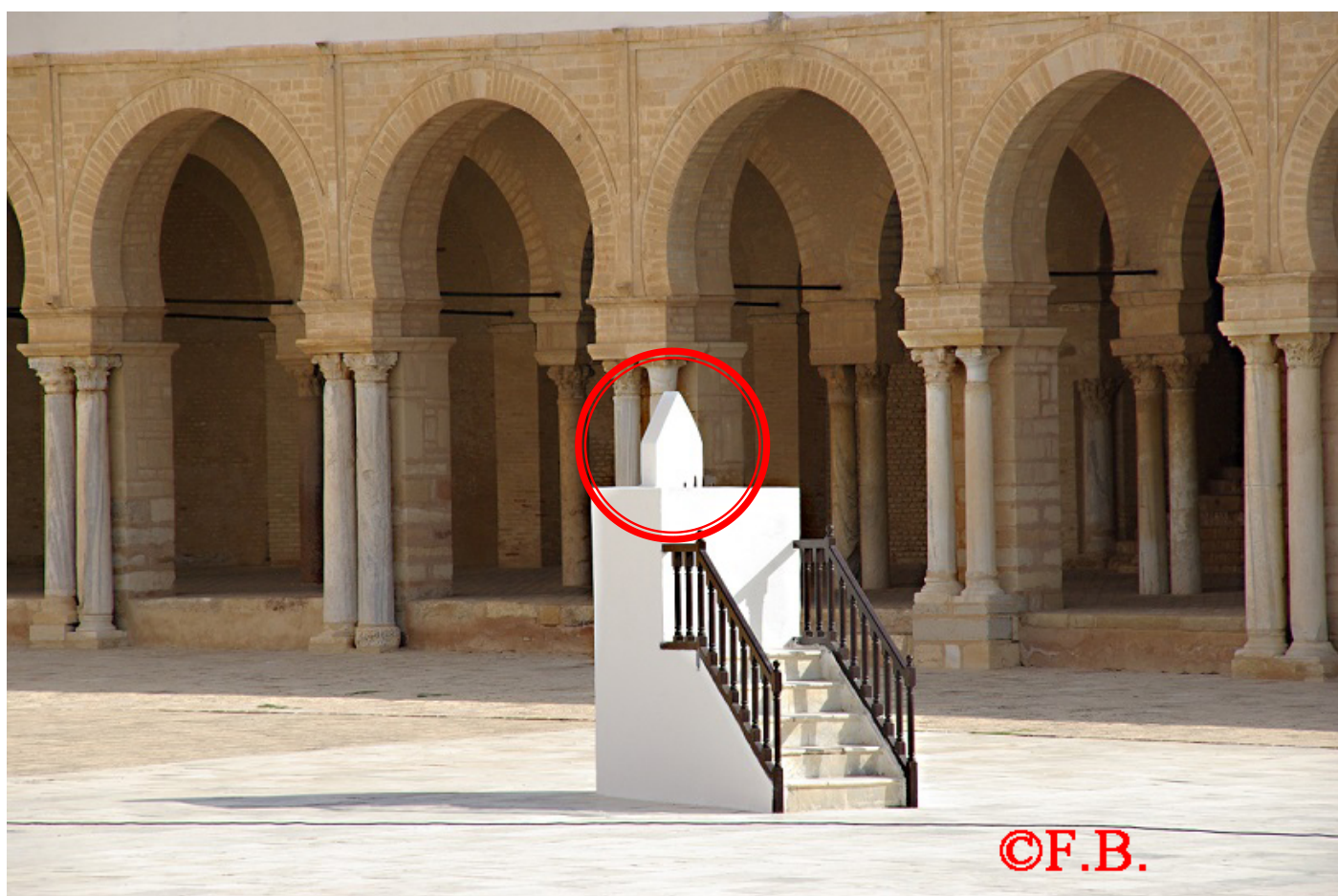
L'escalier du cadran solaire horizontal