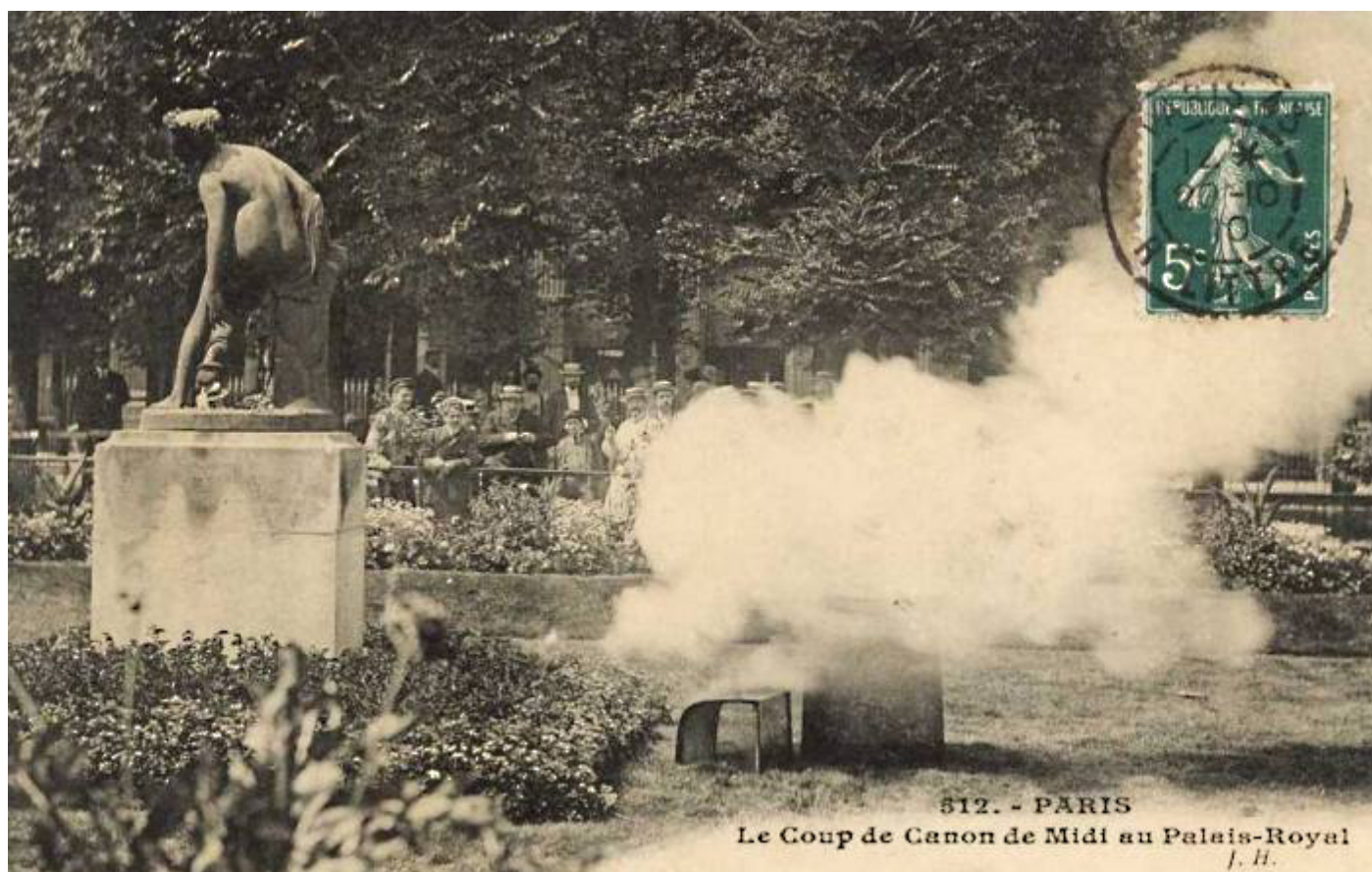
Carte postale – Collection de l'auteur