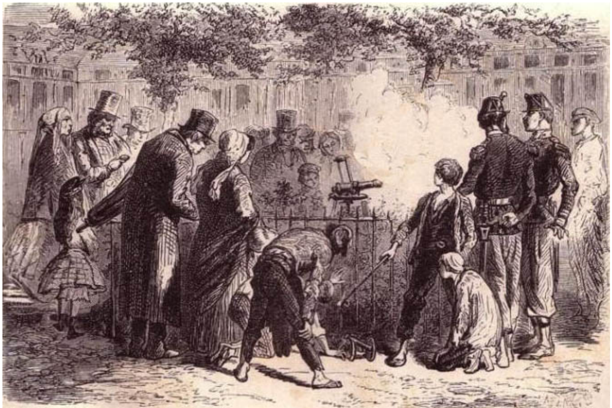
Carte postale – La lentille est visible

Pour retrouver d'autres cadrans solaires parisiens, vous pouvez consulter l'onglet du blog « Cadrans solaires de Paris », et m'adresser sur firstsavoie@gmail.com une commande de mon livre numérique :