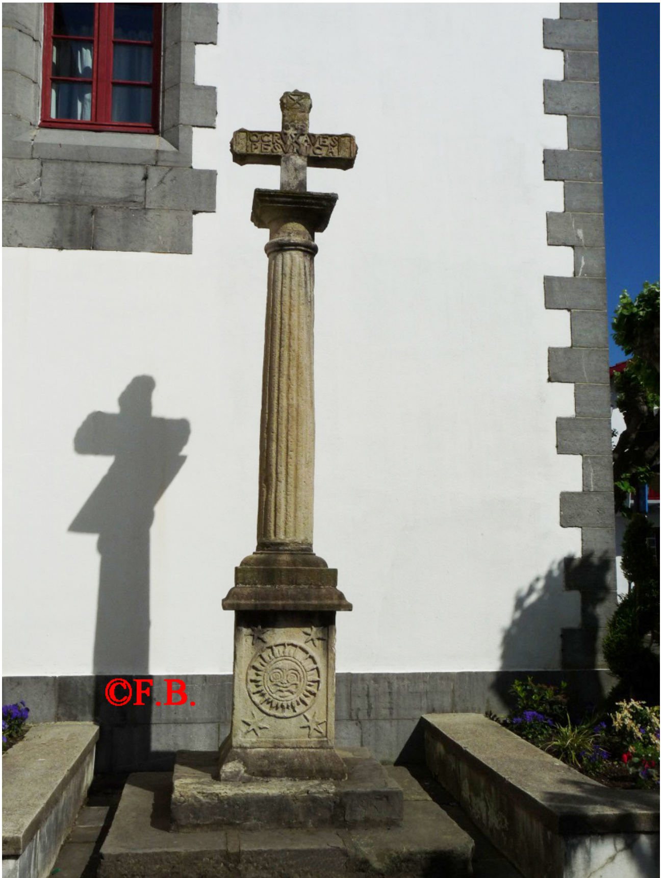
La Croix cylindrique