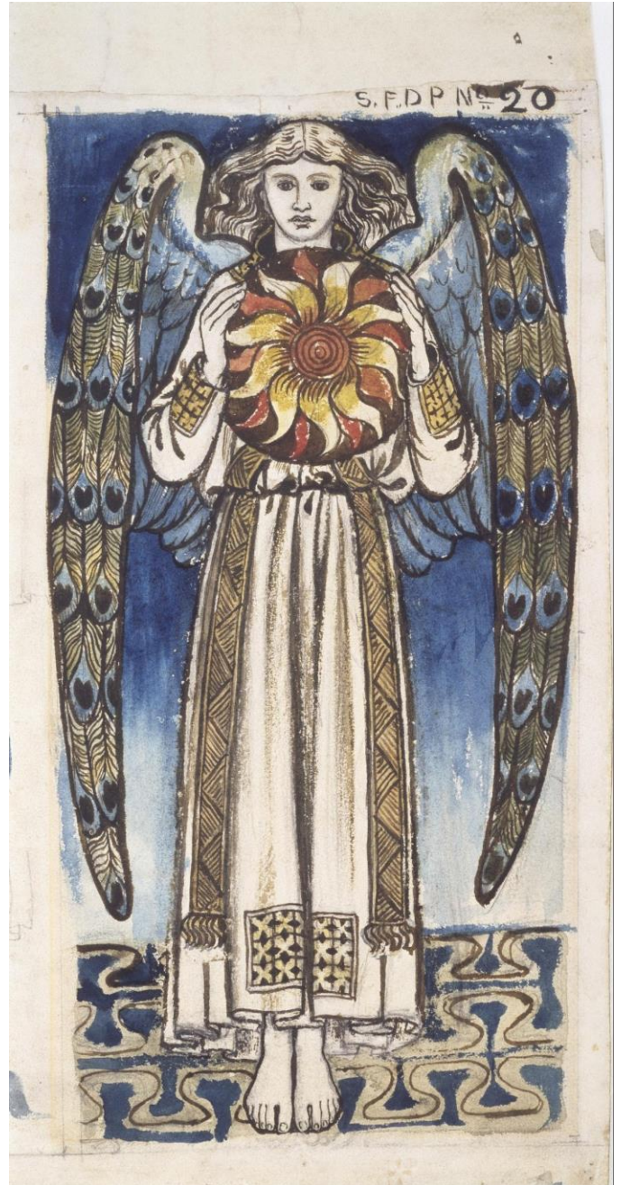
Ange de la nuit tenant une lune décroissante– Jour : Ange tenant un soleil - 1857/1869 William Morris 1834-1896 - Fabricant, designer textile, imprimeur, écrivain, poète, conférencier, peintre, dessinateur et architecte britannique.