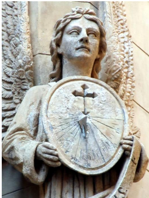
Palma de Majorque