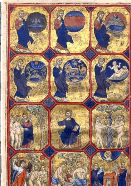
Psautier de Saint-Jean d'Acre