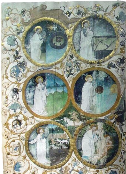
Bible de Jan de Šelmberk,