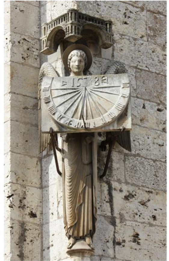
Le premier cadran qui est conservé dans la crypte Carte postale – collection de l'auteur + photos © FB

Dans les enluminures nous trouvons La source d'inspiration des Maître compagnons sculpteurs.