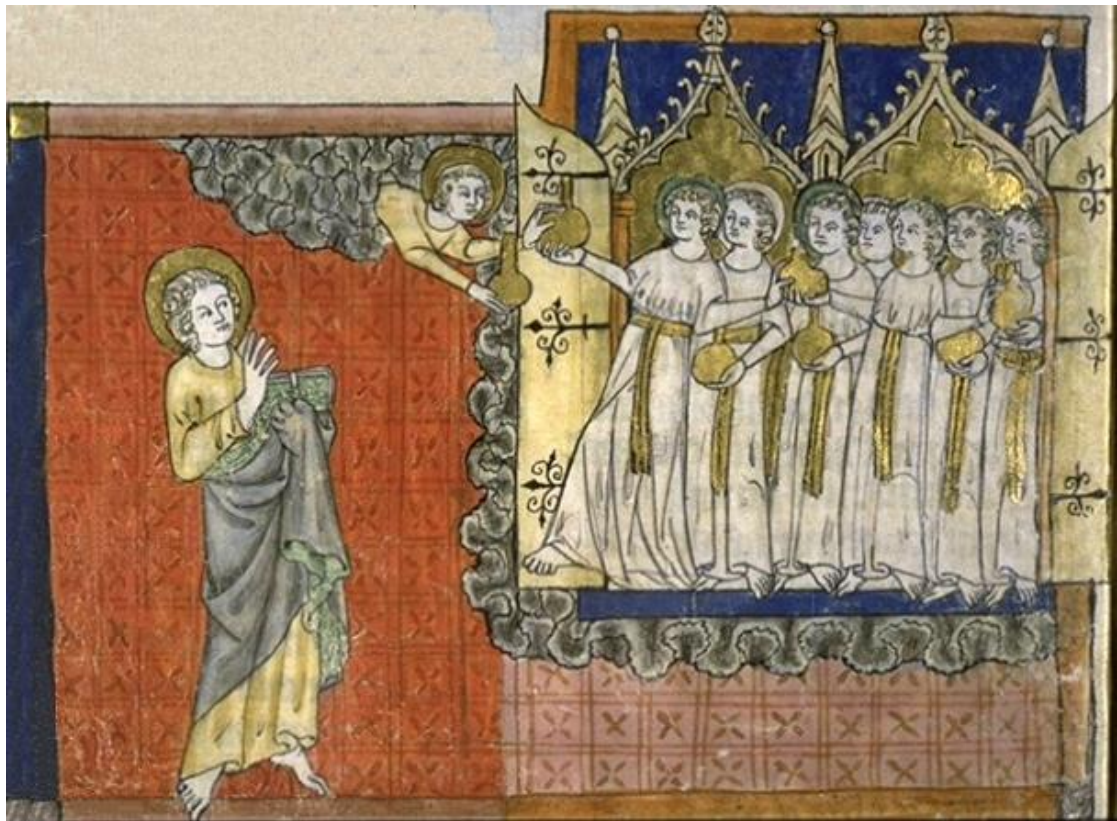
Vision de saint Jean : anges recevant les sept coupes de l'Apocalypse - 1220-1270