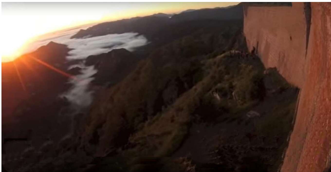
Lever de soleil au château