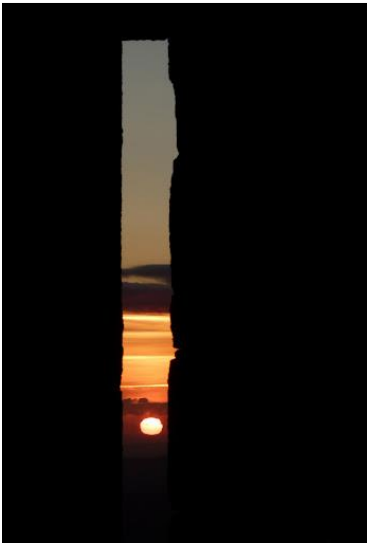
À 06h05, le lever du soleil du 21 juin, façade Nord-Est