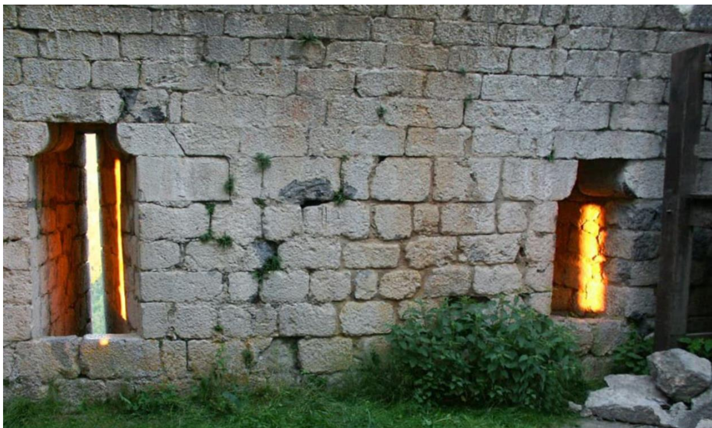
Le phénomène le 21 juin – 6h20

Le 21 juin à 6h20, « l'Astre d'En-Haut » du matin « brille d'un tel éclat », qu'il pénètre par les deux meurtrières du donjon sur le côté Nord-Est, et s'alignent sur les deux archères positionnées sur le mur d'en face. La précision de ce phénomène est d'une fantastique rigueur, mais ne dure que quelques secondes.