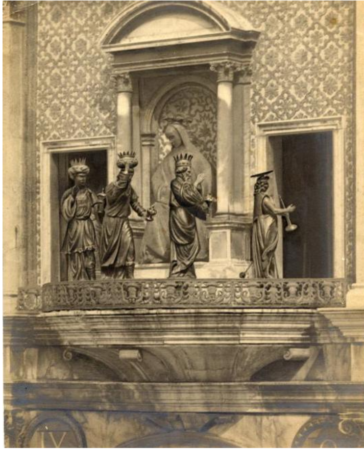
Cartes postales – Collection personnelle