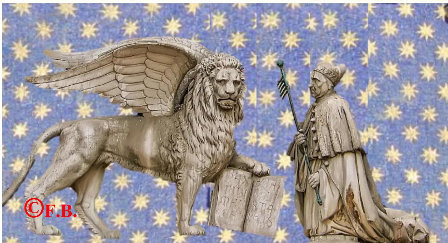
Reconstitution de la fresque avec la statue du lion et le doge Agostino Barbarigo