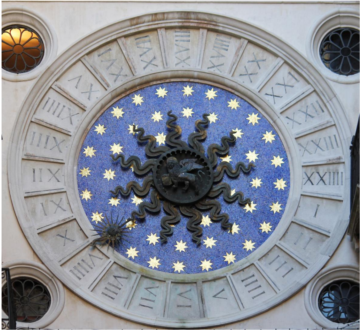
Du côté rue Les ""Mercerie"" désignant la plus ancienne rue commerçante de la ville, qui s'étend de la place Saint-Marc au Rialto, l'horloge astronomique est munie que d'une seule aiguille.