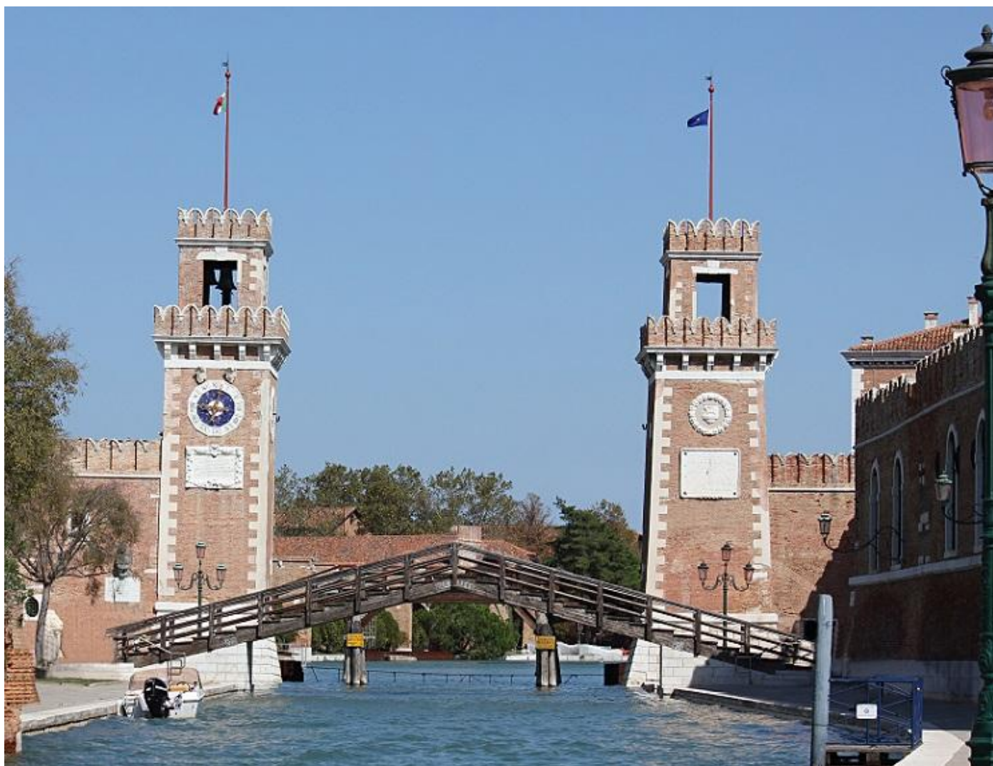
Cadran solaire IT003 de l'arsenal Venise – signé Cap. E.A. d'Albertis