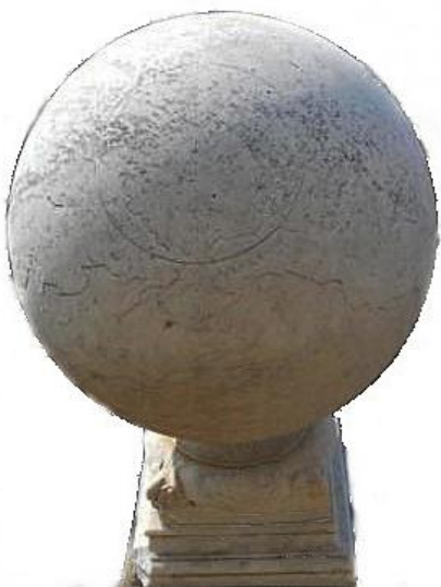
Cadran sphérique IT028