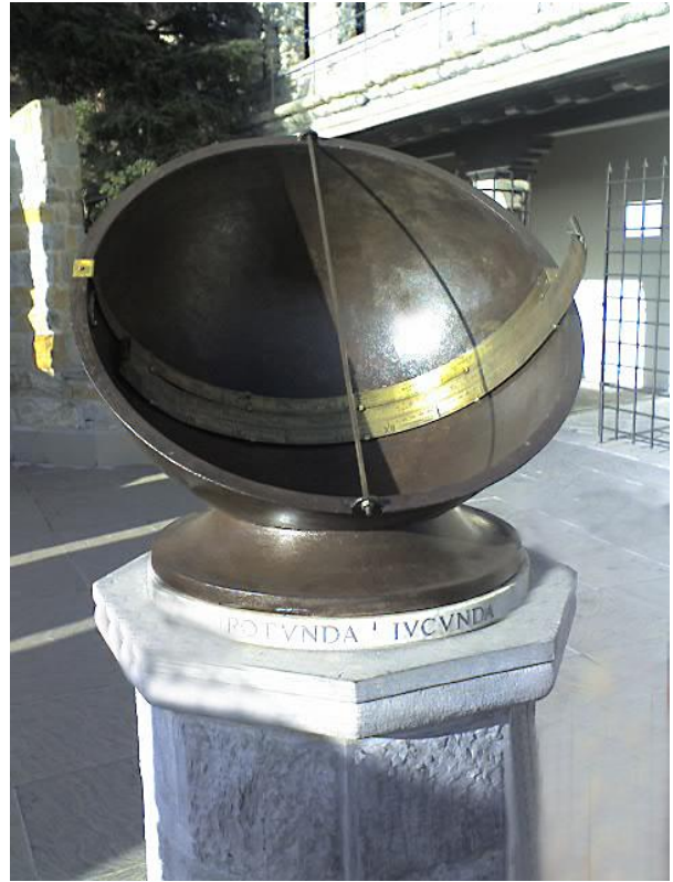
IT023 Cadran equatorial Homan